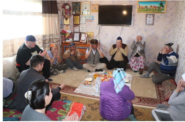
Наурызын баяраар мөргөл үйлдэж буй