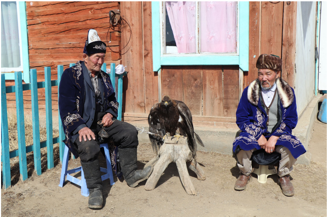
. Сархад ах А. Бүргэдийн хамт