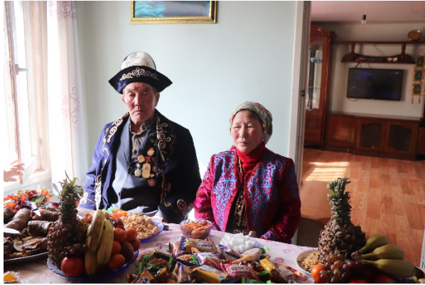
А. Бүргэд гэр бүлийн хүний хамт