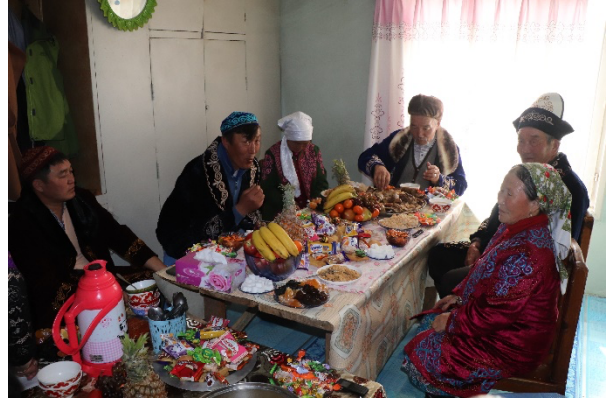
А. Сархад ах А. Бүргэд гэр бүлээрээ наурызын баяраар