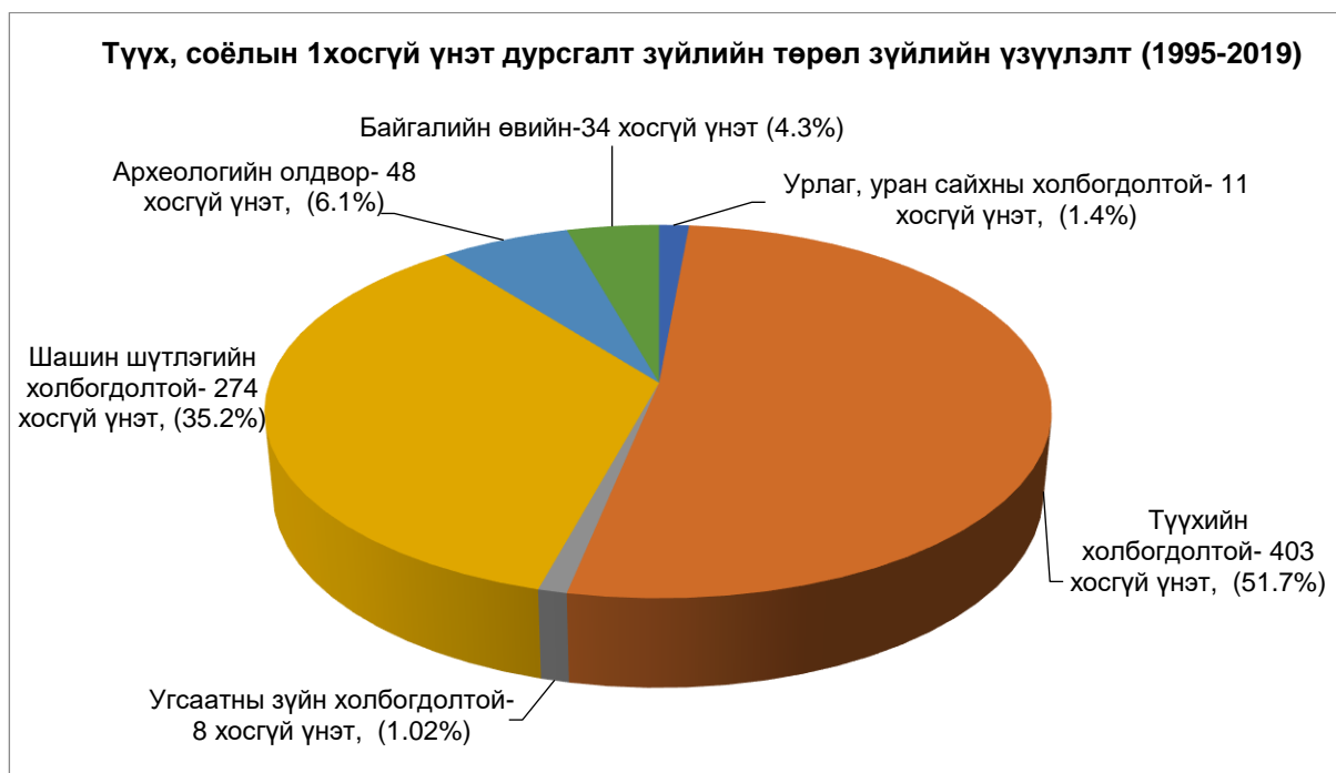
Зураг №1. Түүх, соёлын хосгүй үнэт дурсгалт зүйлийн төрөл зүйлийн үзүүлэлт (1995-2019)