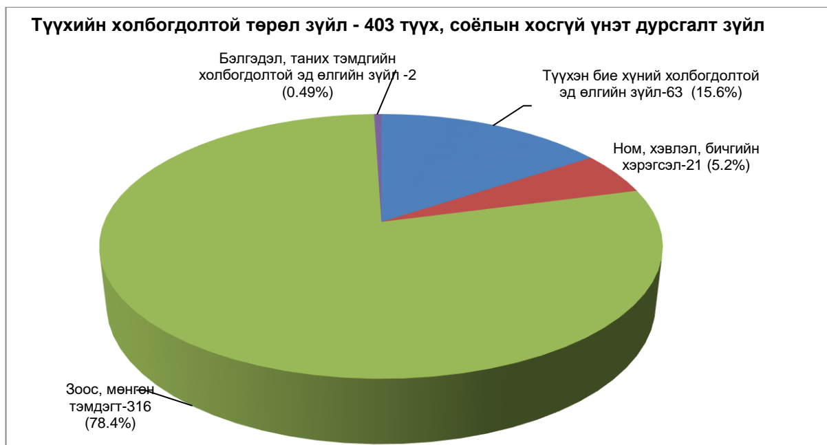
Зураг №2. Түүхийн холбогдолтой 403 түүх, соёлын хосгүй үнэт дурсгалт зүйл

Энэхүү “түүхийн холбогдолтой” төрөл зүйл дотроо хамгийн их хувийг эзэлж байгаа 315 ширхэг зоос мөнгөн тэмдэгт нь гадны хийгээд манай улсад харьцангуй нийтлэг элбэг олдцотой байдаг монголын бага хаадын үед хамаарах зооснууд байна (Зураг №2).