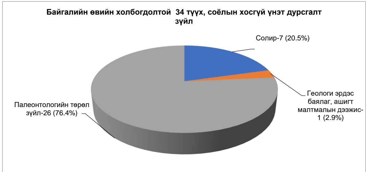
Зураг №5. Байгалийн өвийн холбогдолтой 34 түүх, соёлын хосгүй үнэт дурсгалт зүйл.