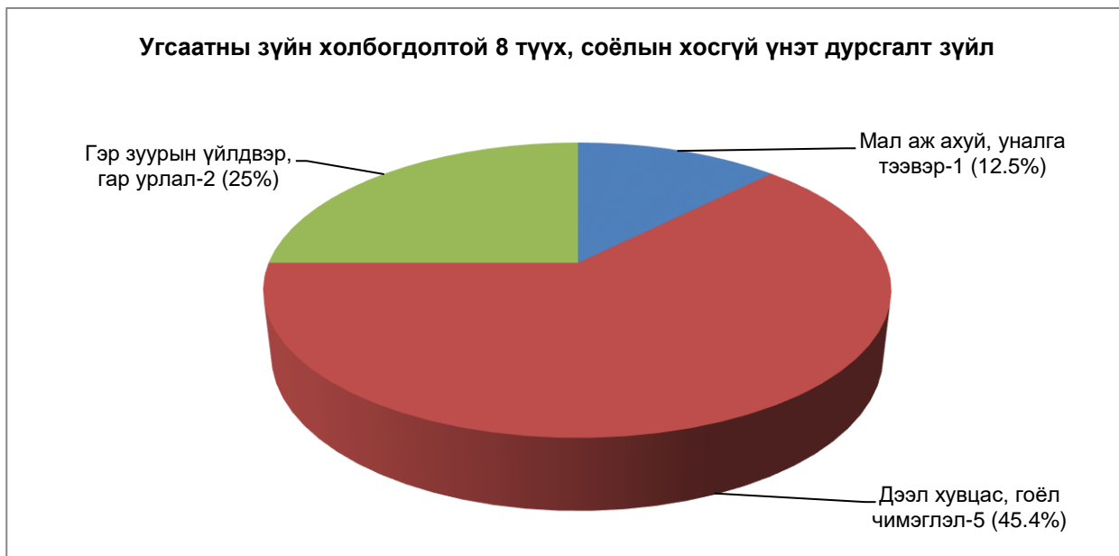
Зураг №7. Угсаатны зүйн холбогдолтой 8 түүх, соёлын хосгүй үнэт дурсгалт зүйл

▪ Угсаатны зүйн төрөл зүйлд 8 түүх, соёлын хосгүй үнэт дурсгалт зүйл буюу нийт хосгүй үнэт дурсгалт зүйлсийн хамгийн бага 1.02%-ийг эзэлж байна. Угсаатны зүйн төрөл зүйлд дээл хувцас, гоёл чимэглэлийн холбогдолтой 5 хосгүй үнэт, гэр зуурын үйлдвэрлэл, гар урлалын холбогдолтой 2 хосгүй үнэт, мал аж ахуй, уналга тээврийн холбогдолтой 1 хосгүй үнэт дурсгалт зүйл зүйл тус тус байна (Зураг №7).