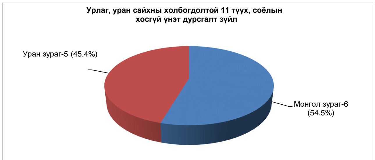
Зураг №6. Урлаг, уран сайхны холбогдолтой 11 түүх, соёлын хосгүй үнэт дурсгалт зүйл

▪ Урлаг, уран сайхны төрөл зүйл хамрагдсан 11 түүх, соёлын хосгүй үнэт дурсгалт зүйл нь нийт дурсгалын 1.4% болох ба үүнд монгол зураг 6 хосгүй үнэт, уран зураг 5 хосгүй үнэт тус тус байна (Зураг №6).